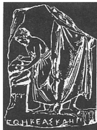
Traitement de la colonne vertébrale – Grèce antique