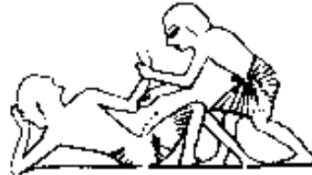
manipulation du coude - tombe de Ramsès II

expression faite de volonté et du moindre crédit !